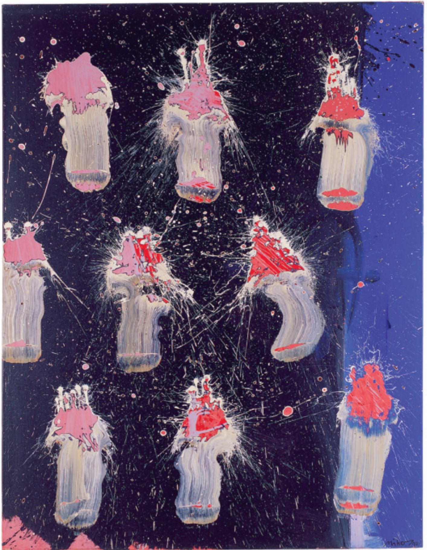
SCHRITTWEISE WEICHT DIE NACHT · STEP BY STEP THE NIGHT RECEDES 1997 · Acryl auf Leinwand / Acrylic on Canvas · 150 x 115 cm