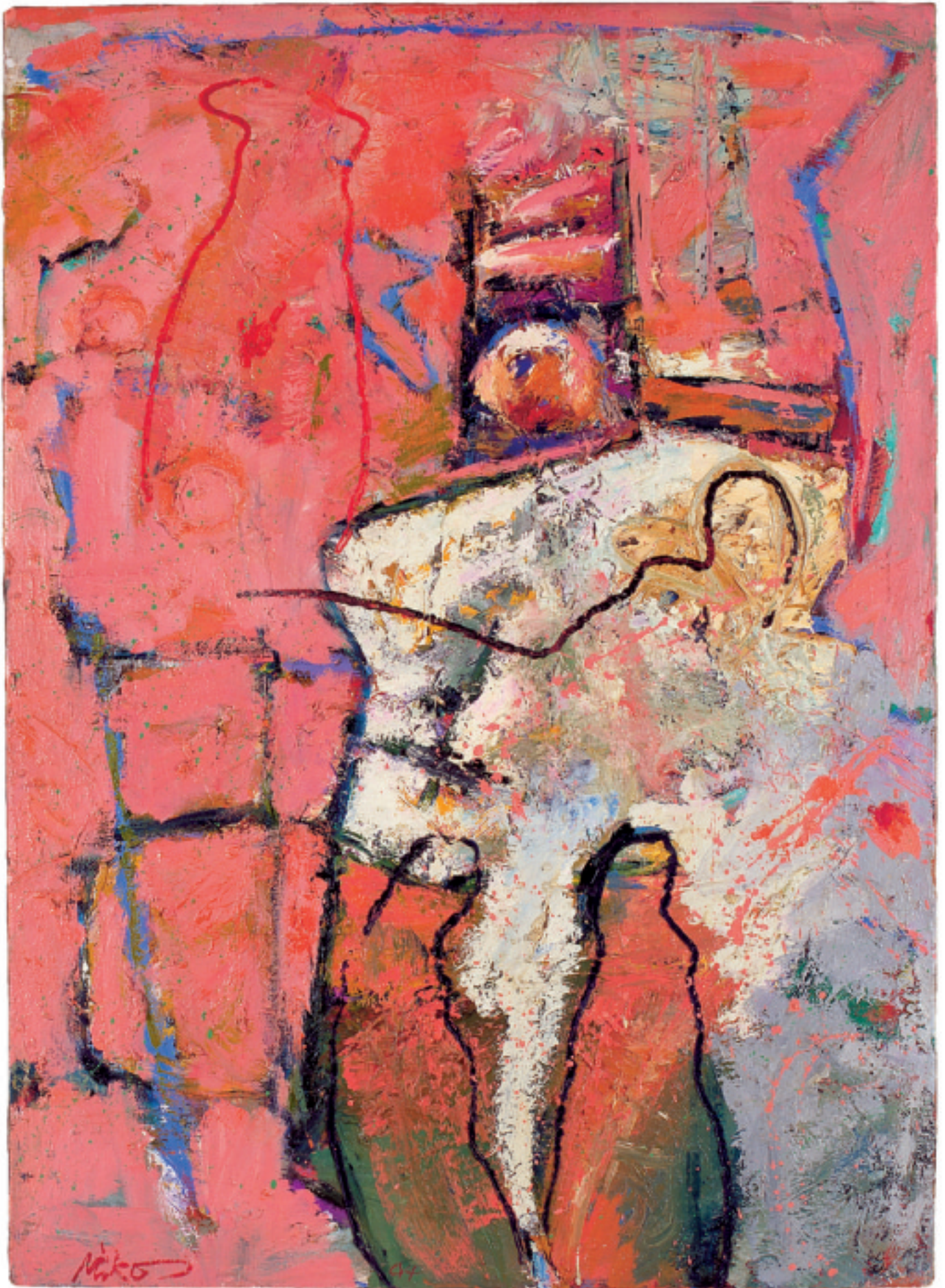
VERSUCHUNG MIT APFEL • TEMPTATION WITH APPLE 1994 • Öl auf Leinwand / Oil on Canvas • 131 x 94 cm