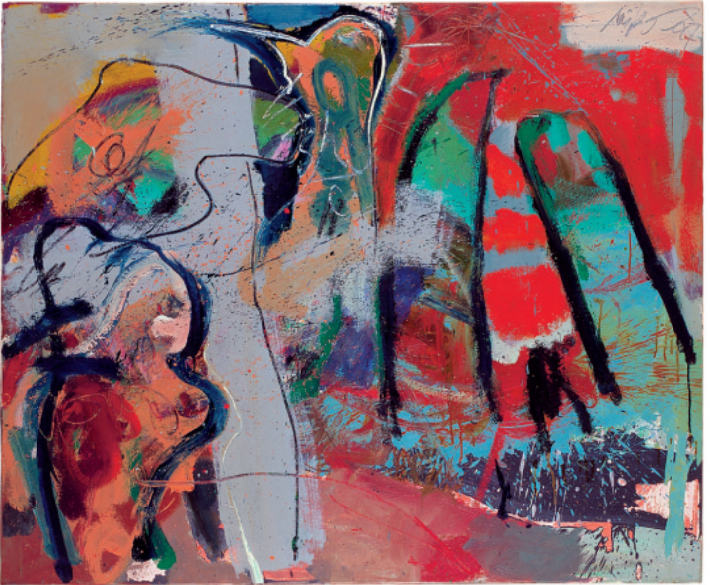
HIN ZUM ÜBERMUT · TOWARDS HIGH SPIRITS 1997 · Acryl auf Leinwand / Acrylic on Canvas · 115 x 140 cm