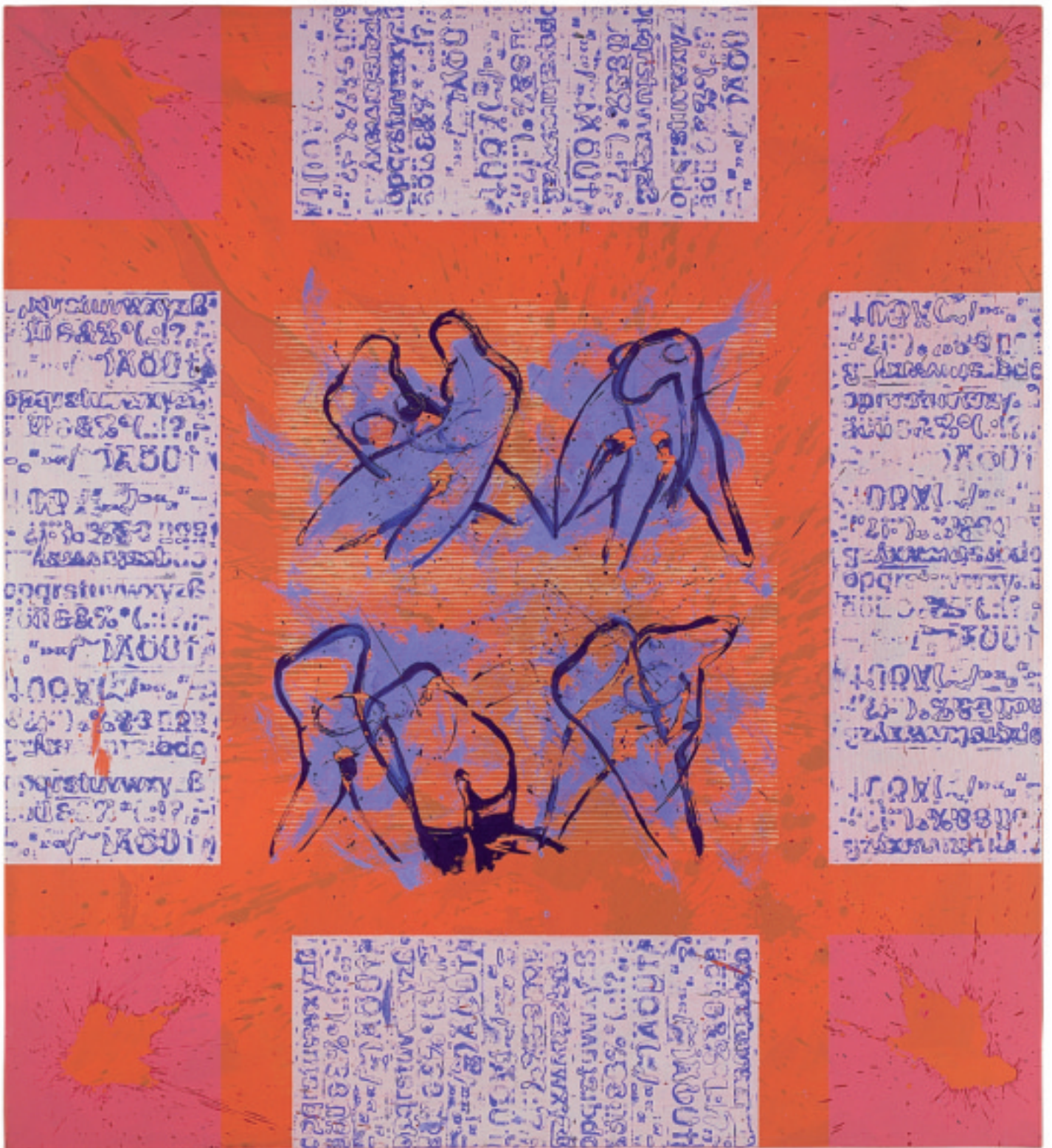
DIALOGUE IM SOMMER – BERLIN • SUMMER DIALOGUES - BERLIN 1998 • Acryl auf Leinwand / Acrylic on Canvas • 160 x 145 cm