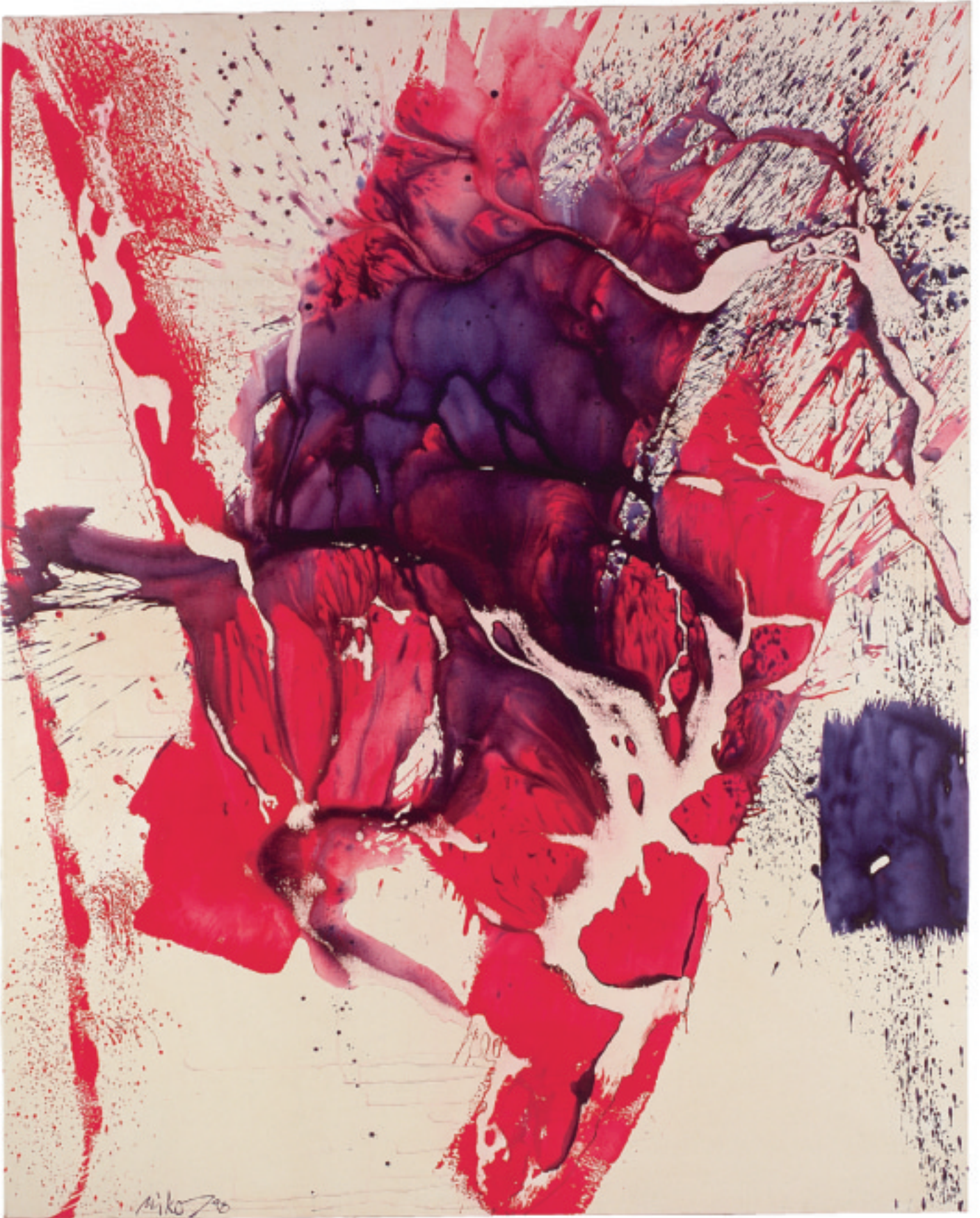
WIE ES SCHLÄGT IN MIR · HOW IT BEATS IN ME 1998 · Acryl auf Leinwand / Acrylic on Canvas · 200 x 160 cm