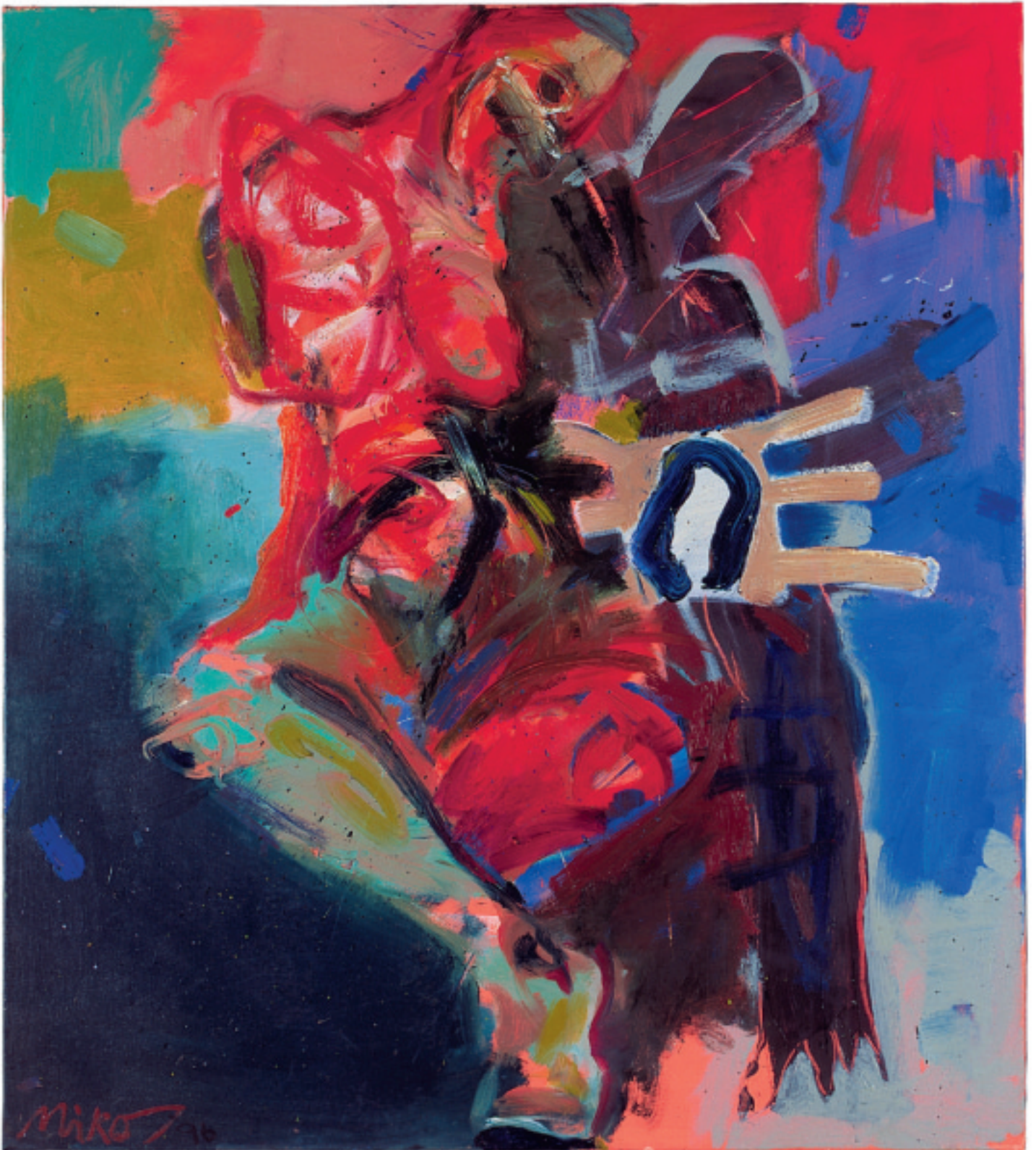
WUNSCH UND BEGEHREN · WISH AND DESIRE 1996 · Öl auf Leinwand / Oil on Canvas · 150 x 130 cm